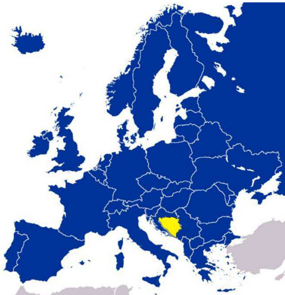
Pozicija Bosne i Hercegovine u Evropi